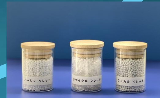
完成したフレークとペレット

原料の調達から輸出、製造（台湾提携工場委託）再輸入、販売まで を自社で行う一貫体制