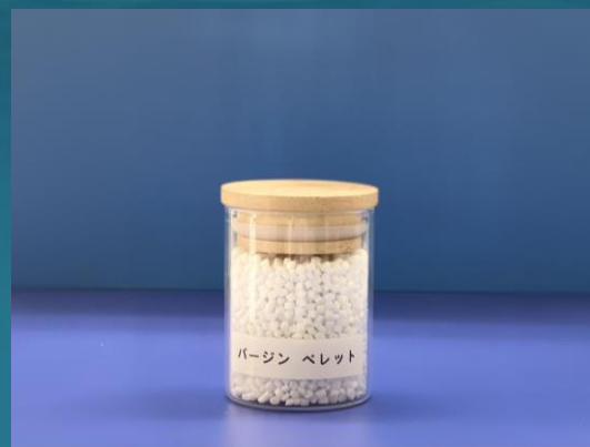
バージン ペレット