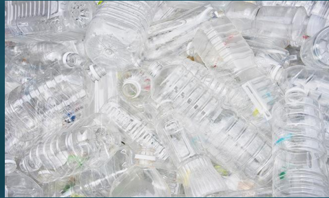
材料となる日本製廃PETボトル