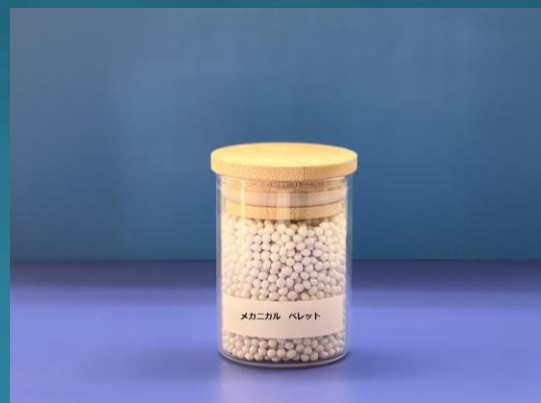
メカニカル ペレット