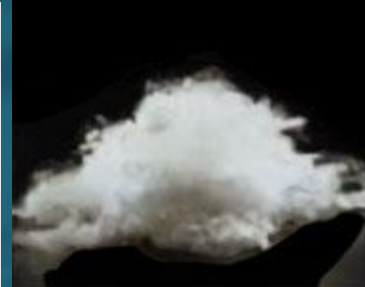
製造したリサイクルPET商品