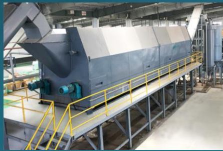
原料ペレット製造（台湾提携工場） 米国FDA認証工場（1000 t / 月）

国内で回収した廃PETボトルフレークを台湾へ輸出 ※廃棄物（再資源物）を輸出するための許可を 経済産業省、環境省から承認されているため輸出可能