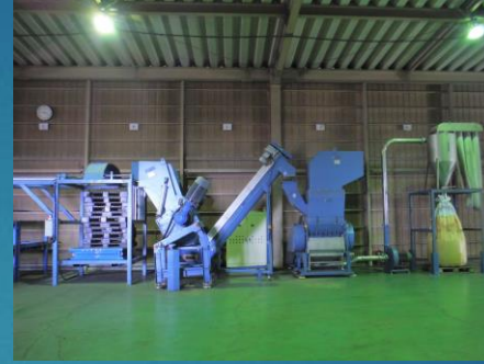
パレット専用破砕機